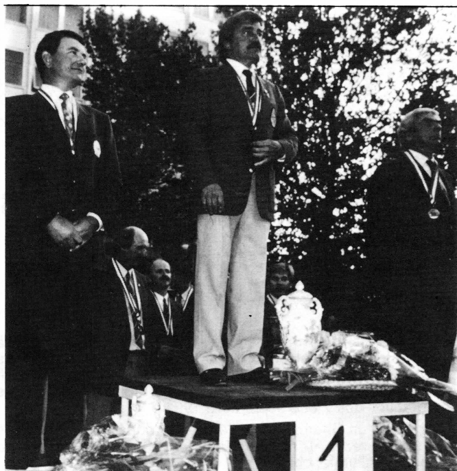
LE PODIUM FRANCE - ANGLETERRE - ITALIE