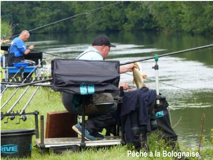
Pêche à la Bolognaise