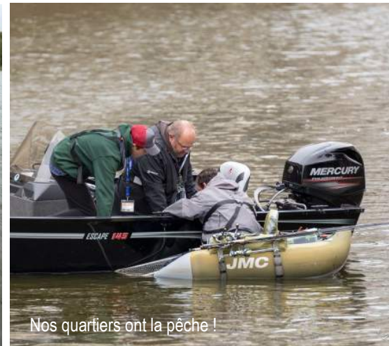
Nos quartiers ont la pêche !