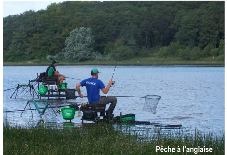
Pêche à l'anglaise