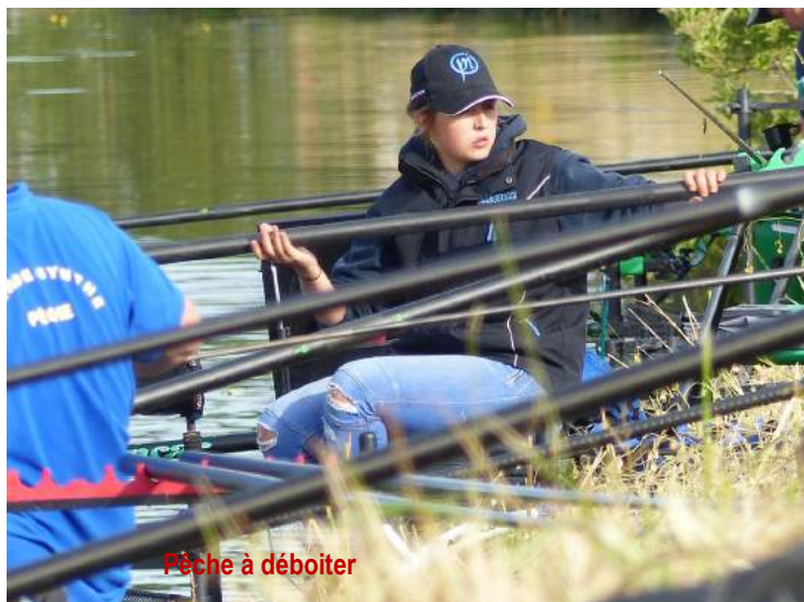
Pêche à déboîter