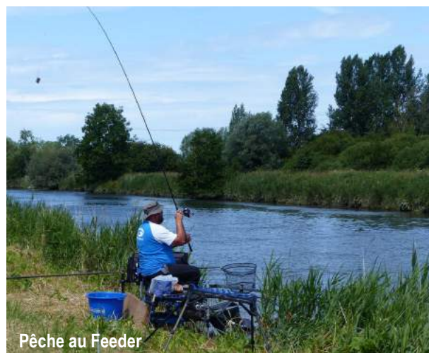
Pêche au Feeder

Une autre technique s'est développée depuis une dizaine d'années, et consiste à pêcher sans flotteur avec uniquement un plomb de poids et de formes différentes. Cette technique est la résurgence améliorée d'une pêche autrefois baptisée pêche à la pelote, elle est dite pêche à la plombée ou au Feeder (terme anglais que l'on peut traduire par amorçoir). Elle se pratique avec une canne à anneaux munie d'un moulinet. Le plomb permet à la fois de lancer la ligne et de la maintenir en place suivant la profondeur et les courants, son poids sera adapté en fonction des conditions de pêche (de 10g à plus de 100g). Le plomb est souvent complété d'une petite cage en métal ou en plastique qui permet de déposer amorces et esches sur la zone pêchée. Les pêcheurs le plus habiles sont capables de rechercher les beaux poissons à 80m et plus.