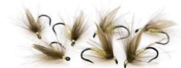
« La Mouche d'Ornans » de Gérard Piquard