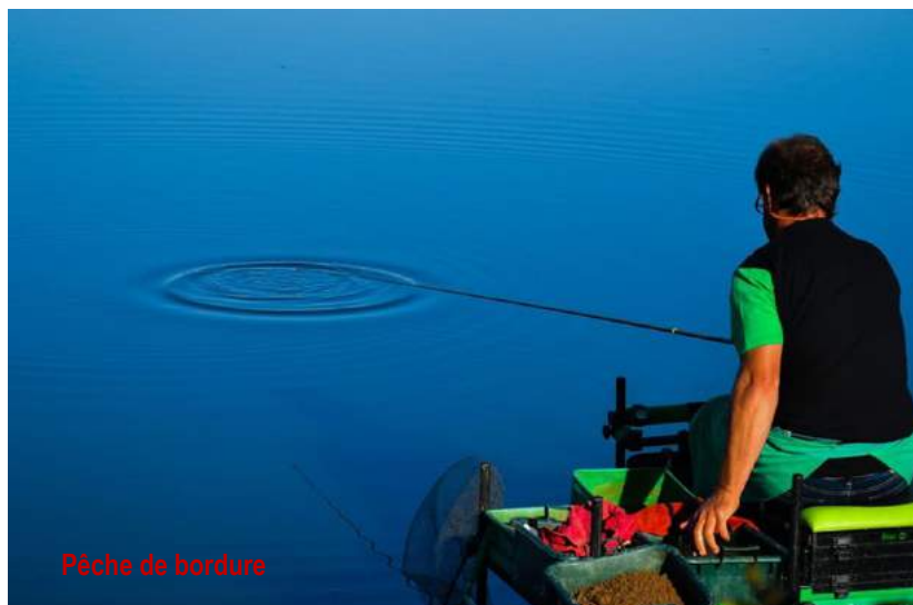
Pêche de bordure

La technique la plus connue est la pêche à la ligne flottante . Le flotteur est équilibré par un ou plusieurs plombs, la ligne permet à l'appât de flotter entre deux eaux, à proximité du fond, ou encore de reposer légèrement sur le fond. La ligne flottante peut être fixée à une canne simple encore appelée grande canne en compétition, ou à une canne munie d'un moulinet. Les cannes au coup peuvent mesurer de 1m à 13m - limitation mise pour éviter de tomber dans un excès connu avant la mise en place de la limitation des longueurs de canne.