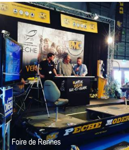
Foire de Rennes